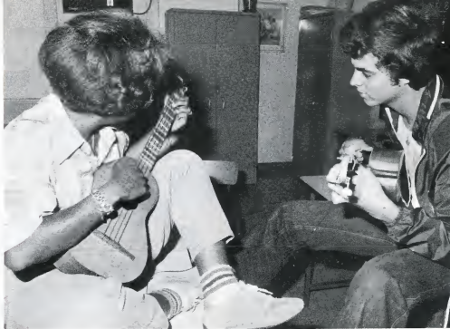
Ondanks de vele problemen wordt er intensief gemusiceerd.

Alle eerder genoemde problemen op de APA zijn weer naar voren gebracht in gesprek van de docenten met de minister van onder-